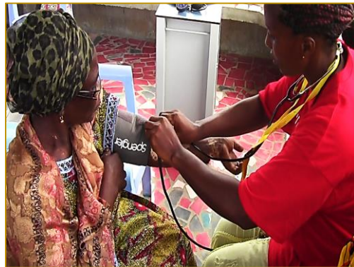
2. Prise de la Tension Artérielle