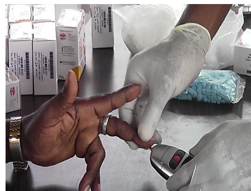
3. Prélèvement de sang

Cet appareil mis à disposition par le partenaire DENK PHARMA permet de faire les tests de glycémie, de triglycémie et du cholestérol