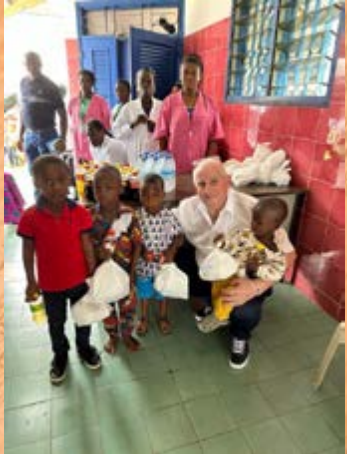
Foto con gli altri bambini bisognosi