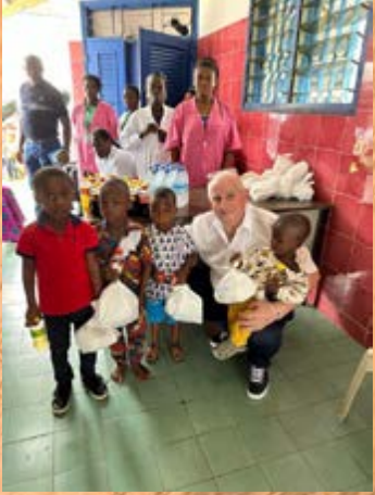
Foto con gli altri bambini bisognosi